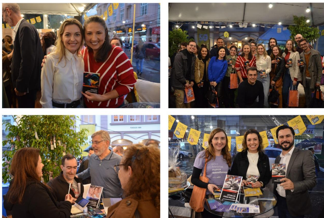
Figura 4 – Mosaico de fotos do lançamento de Textos Introdutórios UFSM