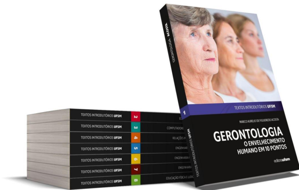
Figura 5 – Destaque do primeiro número da Coleção Textos Introdutórios UFSM