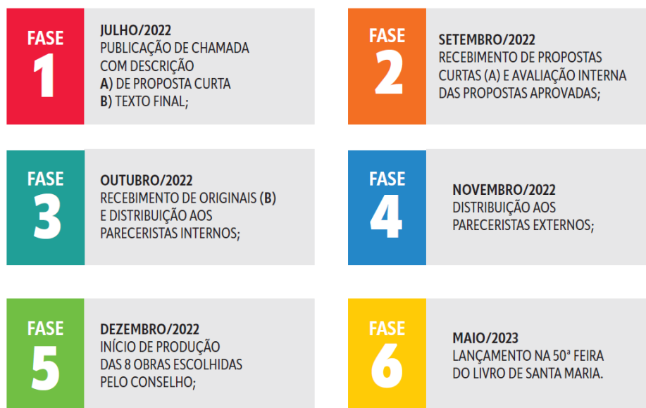
Figura 8 – Cronograma de implementação da Coleção Textos Introdutórios UFSM