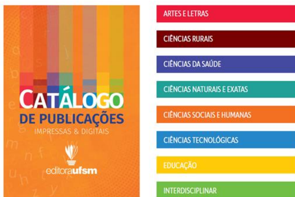
Figura 1 – Catálogo da Editora da UFSM dividido em áreas e cores

Fundada em 14 de dezembro de 1960, pelo professor José Mariano da Rocha Filho, a UFSM tem colaborado com diferentes áreas e saberes, atuando em todos os campos da pesquisa, do ensino e da extensão – além da inovação. É essa unidade na diversidade que caracteriza a complexidade da ação universitária, sem perder de vista a inclusão, a democracia e a interculturalidade. Consolidam essa atuação as oito áreas que constituem nossa organização acadêmica e que norteiam as linhas de produção da nossa editora (Figura 1), a saber: Artes e Letras, Ciências Rurais, Ciências da Saúde, Ciências Naturais e Exatas, Ciências Sociais e Humanas, Ciências Tecnológicas, Educação e, por fim, Ciências Interdisciplinares.