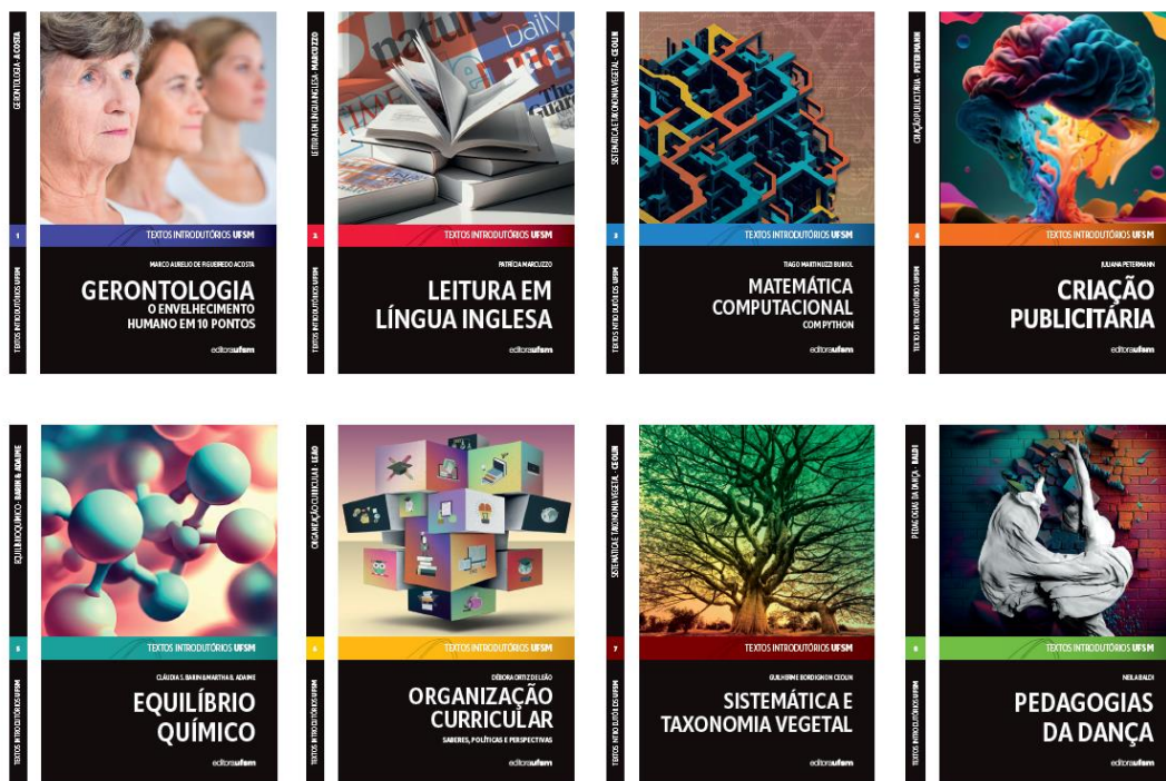
Figura 6 – Mosaico com as capas do primeiro ciclo de Textos Introdutórios UFSM