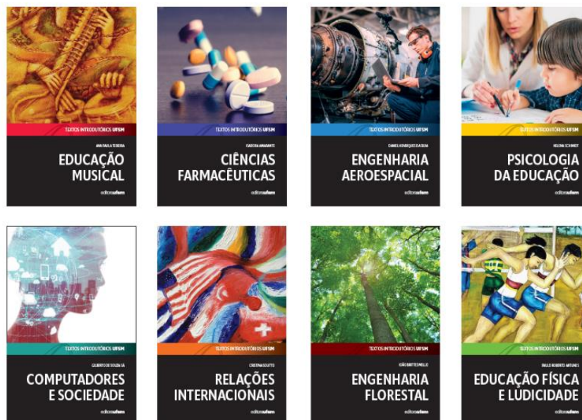
c) Figura 3 – Fases de planejamento da Coleção Textos Introdutórios UFSM

Os livros foram planejados no formato 11×17cm, com limite de 156 páginas. A impressão da capa seria feita em 4 cores de seleção, no papel Cartão Supremo Alta Alvura 250 g/m 2 , com acabamento plástico fosco, e o miolo seria impresso em tons de cinza, no papel Pólen Soft 90 g/m 2 . A tiragem inicial de cada volume da coleção seria de trezentas unidades, tiragem atualmente praticada em nossa editora. Porém, levando-se em conta que seriam oito títulos, o total somaria 2.400 exemplares.