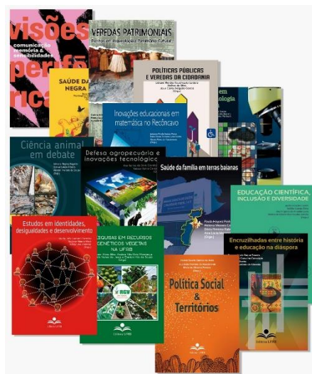
Figura 2- Capas da Coleção Pesquisas e Inovações Tecnológicas na Pós-Graduação da UFRB.